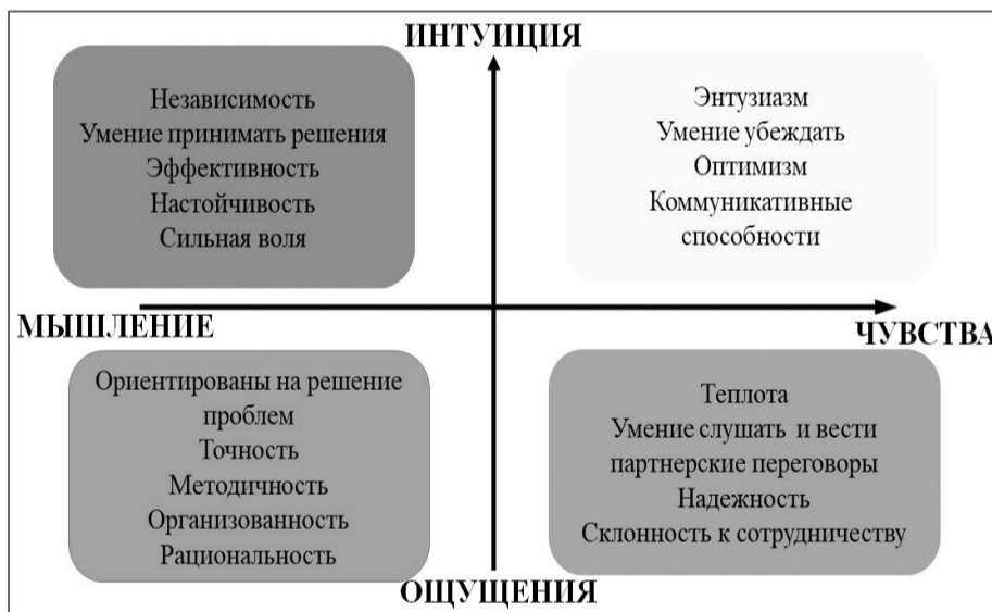
Схема 2. Характеристика типов поведения

мультфильмов, вы наверняка неоднократно встречали на своих уроках детей, похожих на них, не так ли? В каждом классе есть дисциплинированный ребенок, который выполняет требования учителя, десятки