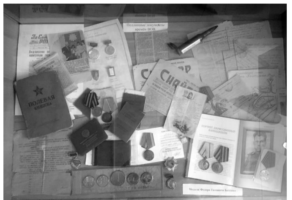
Боевые награды, документы военных лет