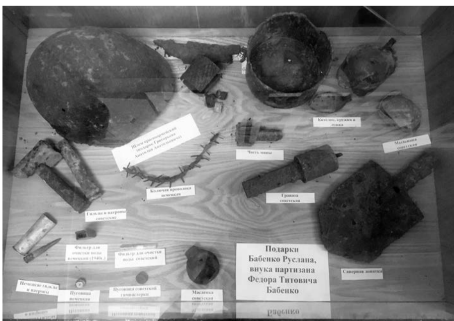
Некоторые экспонаты переданы в дар внуками партизан